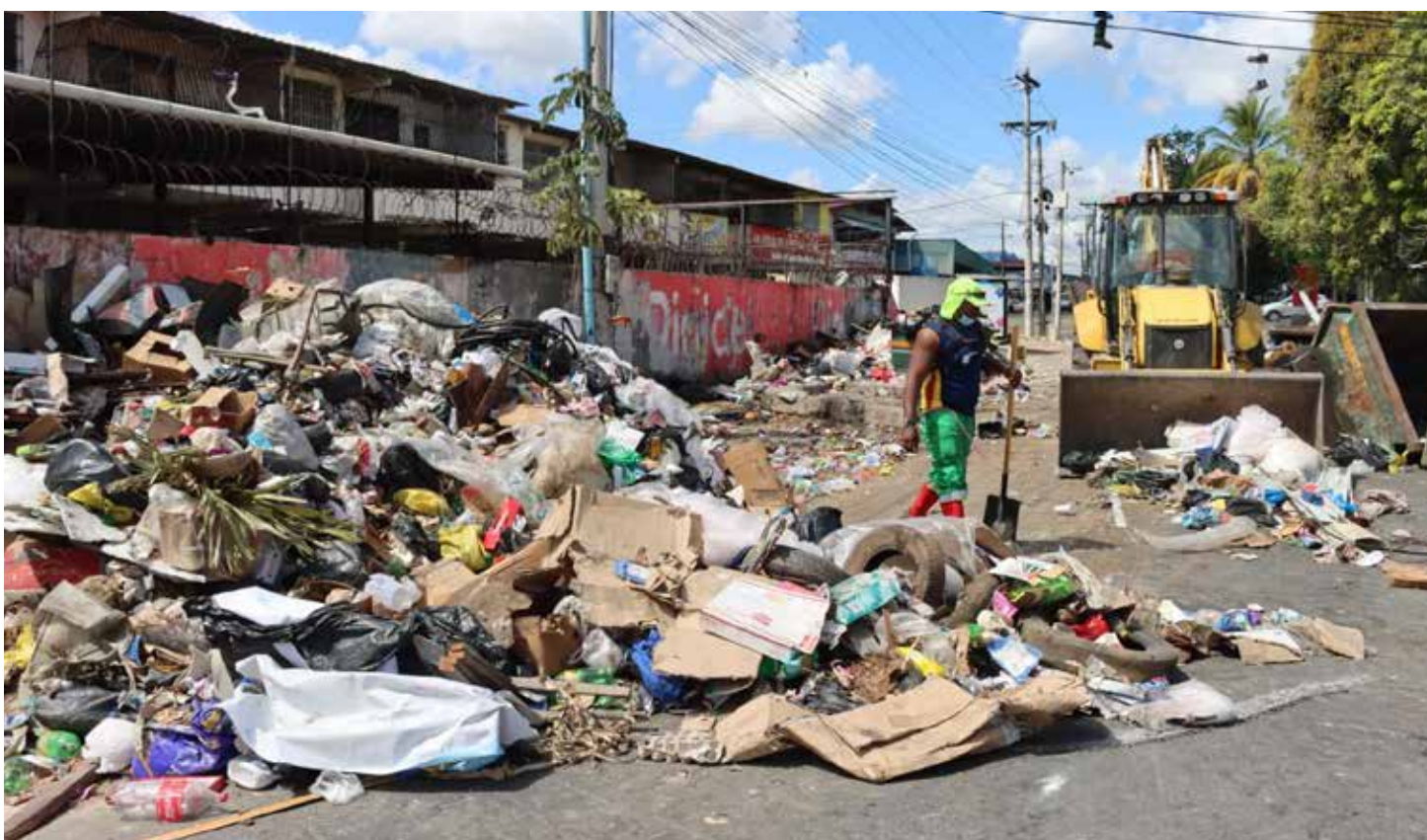
Operativo de recolección entre Monte Oscuro y el corregimiento de Río Abajo en el distrito de Panamá

evitar que arrojen basura a los predios y habilitar el área para actividad comercial que beneficie a los residentes. Se recolectó un total de 27 toneladas.