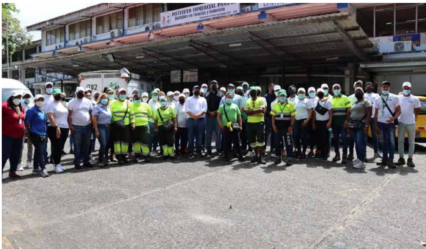
Jornada de limpieza en el Instituto Comercial Panamá

Se trata de una iniciativa implementada por el gobierno central denominada "Conescuela" en la que diferentes instituciones unen esfuerzos para rehabilitar los planteles educativos de cara al inicio de clases. Este viernes le correspondió al Instituto Comercial Panamá en Pueblo Nuevo donde la Autoridad de Aseo apoyo junto con la Junta Comunal del corregimiento con poda de árboles, corte de grama, fumigación y limpieza de áreas comunes. Pedro Castillo Garibaldi, Administrador General de la AAUD resaltó que son más de 600 colegios a nivel nacional los que están siendo intervenidos por medio de este programa y que busca que el regreso de los estudiantes se dé, de una manera segura, ordenada y sana. Personal de las damas de barrido, servicios generales y técnico de la AAUD participaron de esta jornada de habilitación del plantel educativo.