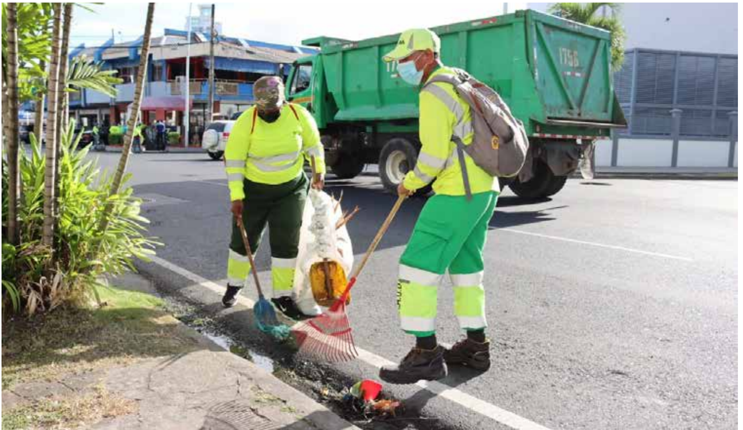
Jornada de limpieza y recolección en Bella Vista