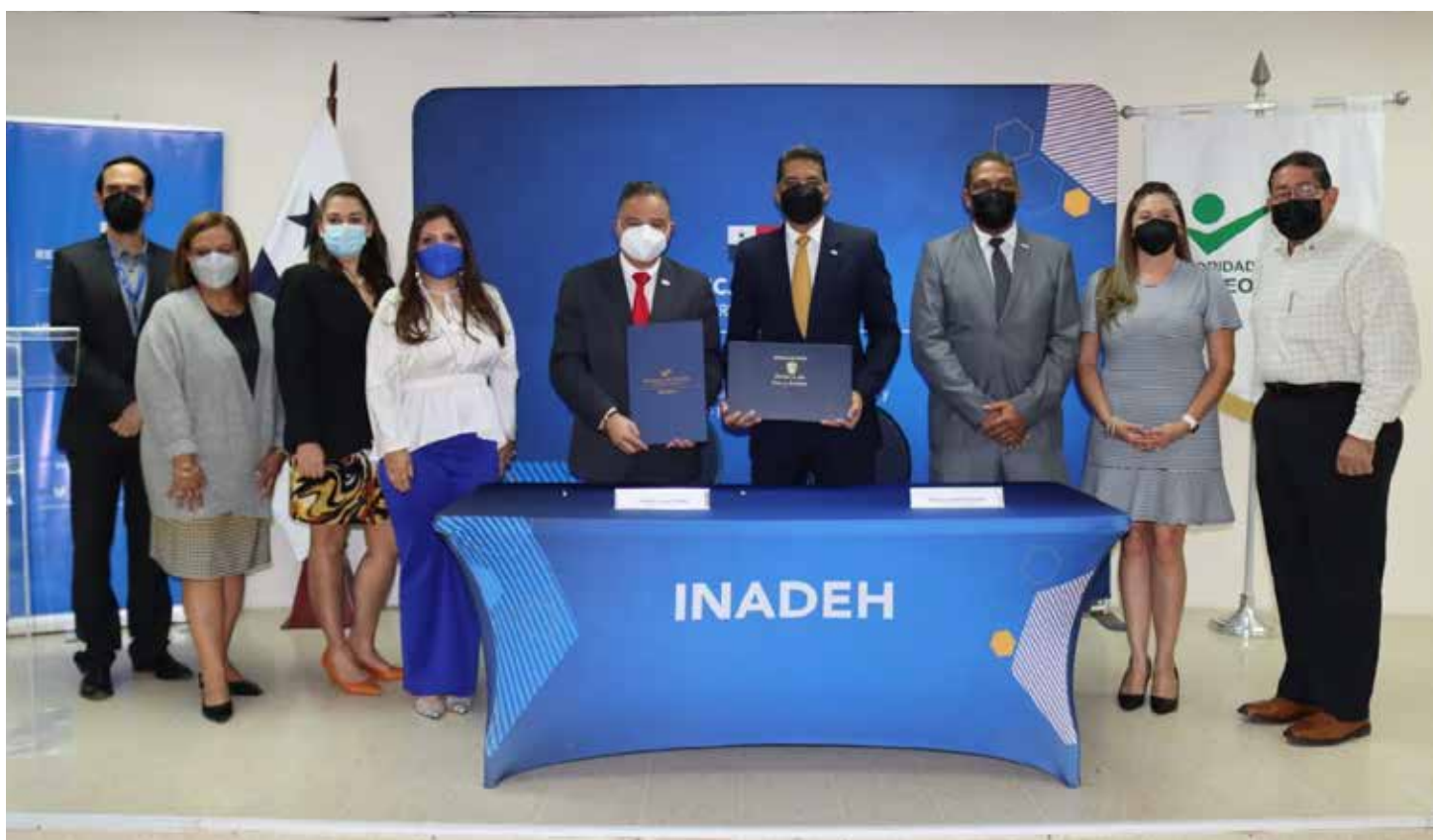
Convenio de cooperación y asistencia técnica entre la AAUD y el INADEH