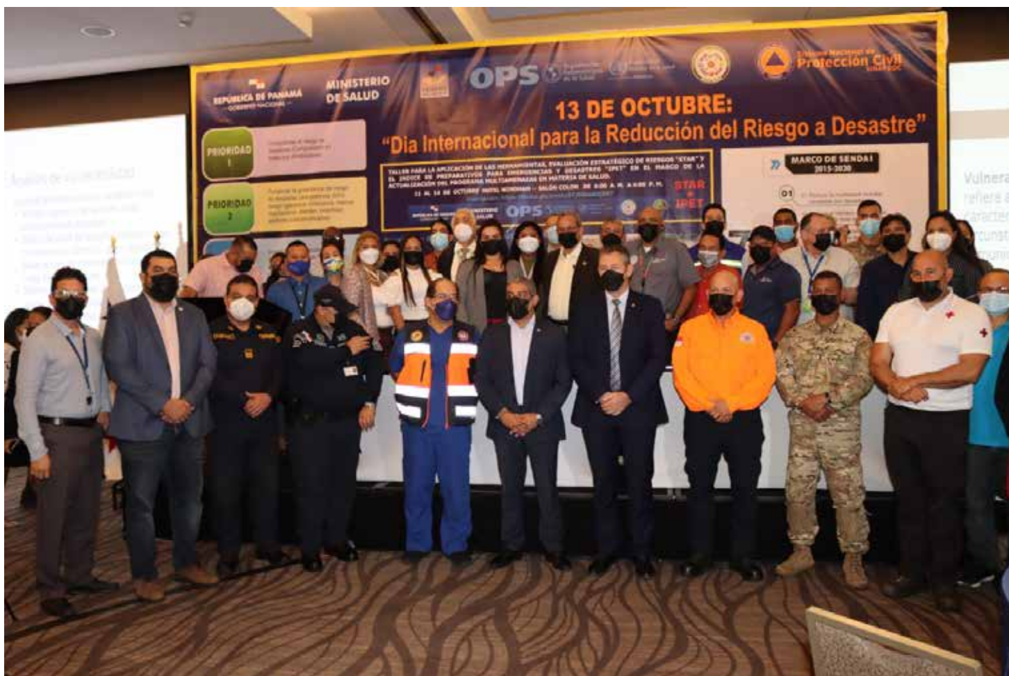
Taller por el "Día Internacional para la Reducción del Riesgo de Desastres"

naturales, antrópicas, biológicas y ambientales que pueden generar emergencias y desastres, así como la capacidad para la recuperación temprana ante los efectos de los eventos adversos que ocasionen al sector de la salud. El taller se dividió en dos espacios y la integración de los participantes diferenciados según las competencias y responsabilidades de cada equipo de trabajo.