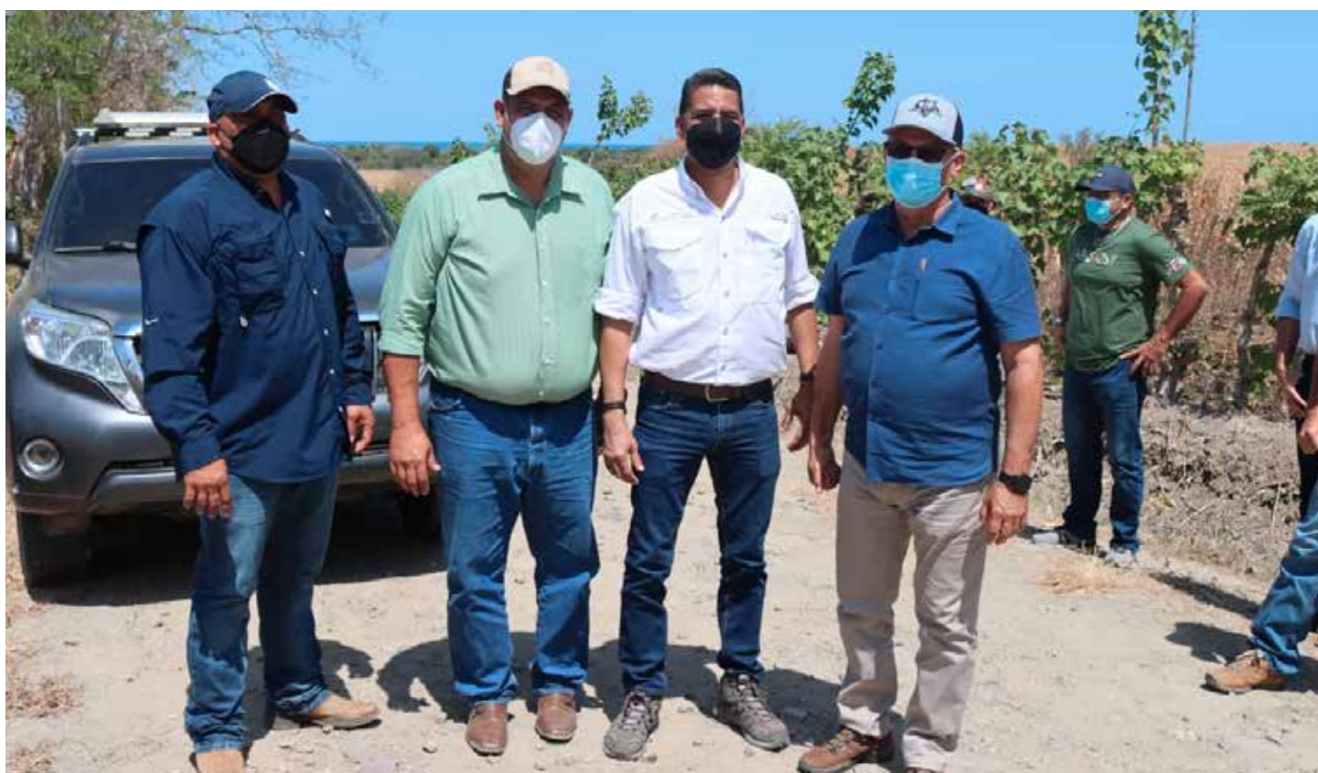
Administrador General, Pedro Castillo, realizó visita técnica en el distrito de Pocrí provincia de Los Santos, junto a su equipo técnico

necesario construir un solo vertedero debido a que en la actualidad existen unos siete vertederos a cielo abierto, lo cual están mal manejados, son focos contaminantes y generadores de vectores, lo cual puede atentar contra la salud pública. Se hizo entrega de bolsas biodegradables así como equipo de protección para el personal de la alcaldía para apoyarlos en sus jornadas de trabajo, procurando sigan guardando las medidas de bioseguridad.