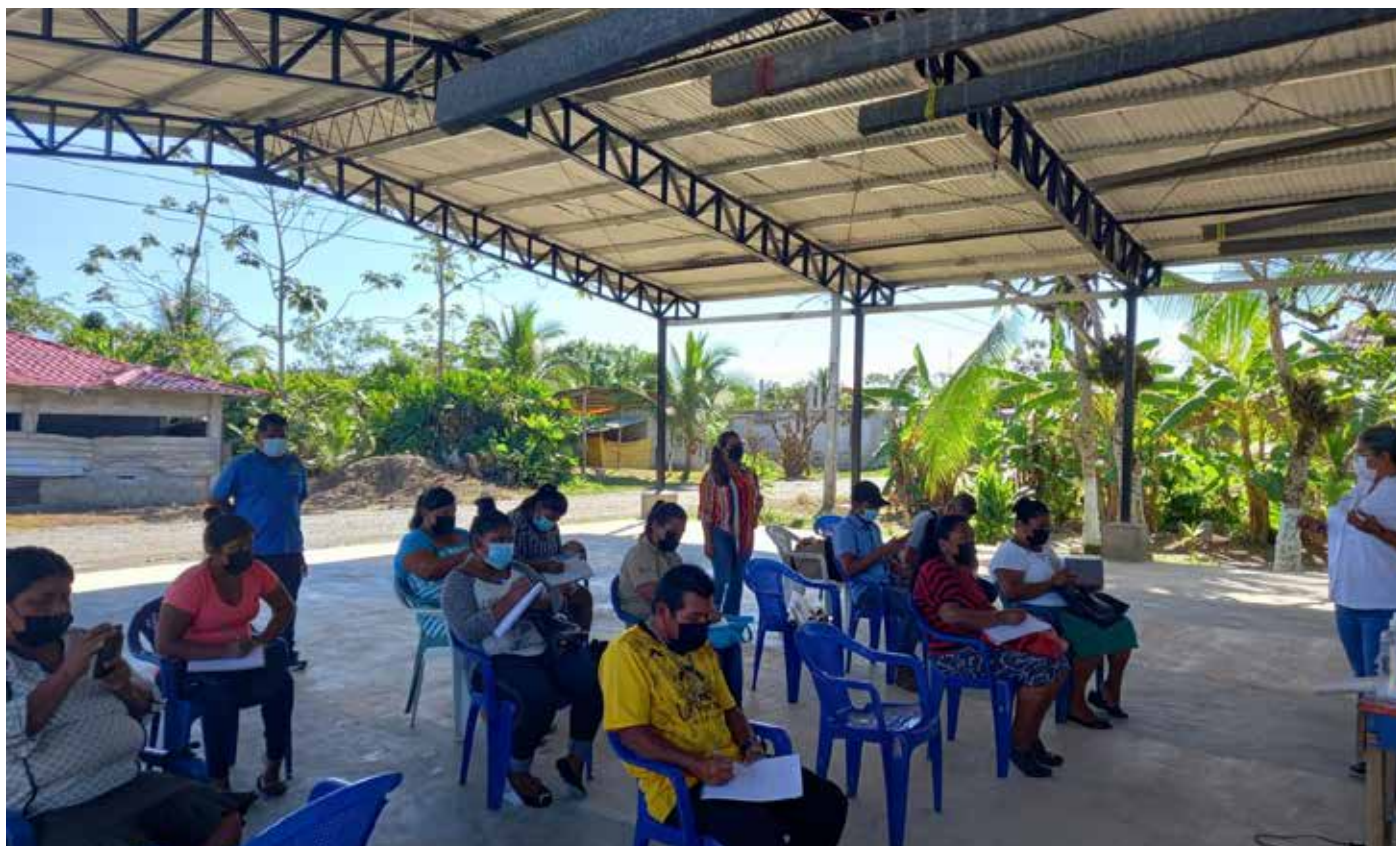
Coordinadora regional de Bocas del Toro, participa en el taller de capacitación en el sector 3 y 4 del corregimiento 4 de abril

La AAUD a través de la coordinadora regional de Bocas del Toro, participa en el taller de capacitación sobre manejo de residuos orgánico y elaboración de compostaje, en el marco de la ejecución del proyecto “Manejo y Disposición Adecuada de los Residuos Sólidos” que se ejecuta en el sector 3 y 4 del corregimiento 4 de abril, gestionado por la Asociación para el Desarrollo Humano Sostenible y la Conservación de la Biodiversidad, a través del Programa de Pequeñas Donaciones (PPD) que es un programa corporativo del Fondo de Medio Ambiente Mundial (FMAM) implementado por el Programa de Naciones Unidas para el Desarrollo (PNUD) desde 1992.